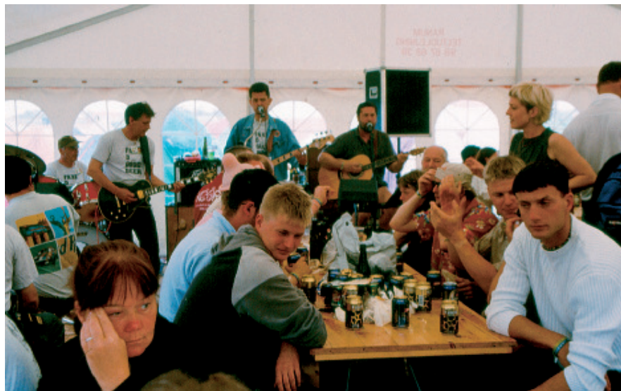
Lørdag morgen i 'Oasen'. Det lokale orkester West for Wrist »reparerer tømmermænd«, mens publikum spiser morgenmad og gør klar til en ny dag på festivalen.

Fredag eftermiddag begynder det musikalske program. Musikken på festivalen præsenteres fra de to scener – de største musikalske