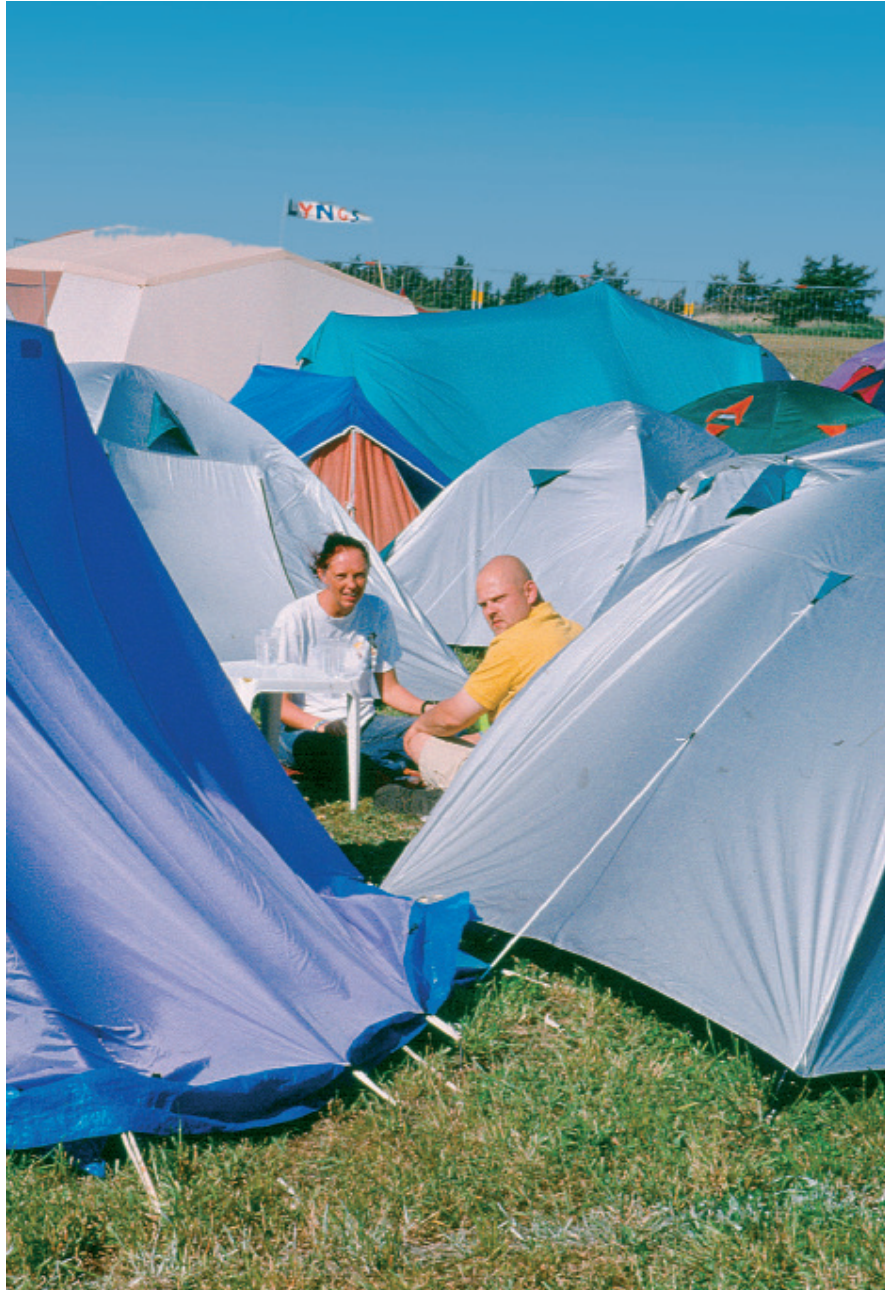
En stor del af festivallivet leves på campingpladsen. Deltagerne indretter sig gruppevis i små lejre og forsøger ved hjælp af stole, bannere og skilte at afgrænse deres område fra andres. (Foto: Lemvig Museum).