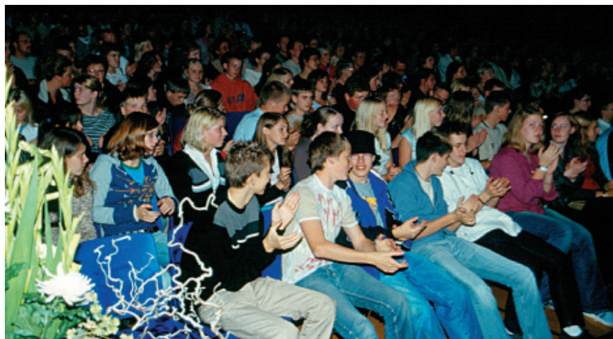
På gospelfestivalen samles alle deltagere om at høre musikken, som er det centrale element i arrangementet. Vil man drikke en sodavand eller snakke med gamle venner, må man gøre det i pausen mellem koncerterne.

»Det skal ikke være nogen hemmelighed, at vi gør det for at udsprede det kristne budskab gennem sang og musik, men også at folk skal vide, at vi er ikke sådan nogen nokkefår, der ikke kan finde ud af det. At der også er populær musik inden for den kristne genre. Derfor gør vi det. (...) Det er også for at prøve at fortælle dem, der måske ikke kommer i vores kreds normalt, at hold op kan kristen musik lyde så godt. Også fordi at mange har en forestilling om det der med at være kristen, at de er nogle hængehoveder og mørke og triste at se på. Det behøves de ikke at være. De må godt være glade og se lyst på tingene, det behøver ikke at være med nedbøjet hoved. Det er formålet.« (Interview med arrangør).