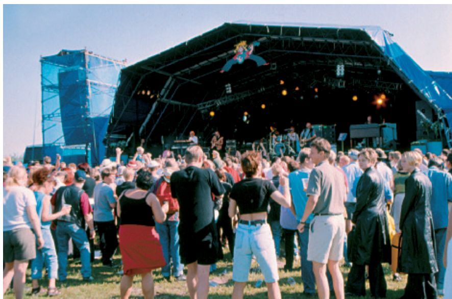
Koncert fra store scene. For unge mennesker, som er flyttet fra egnen, er Haze over Haarum en årlig anledning til at træffe familie og gamle venner. Flere deltagere beskriver festivalen som den årlige familiefest på Harboøre. (Foto: Lemvig Museum).

kvinder i køen foran toiletskuret, midaldrende mænd i shorts og kasket som drikker fadøl i 'Oasen', kræmmere der sælger alt fra festivalfastfood til eksotiske hatte, familier med madkurve og store vat-tæpper på festivalpladsen og børn, der slæber bæreposer fyldt med tomme flasker hen til flaskecentralen og bytter dem til lommepenge. Hele det store arrangement styres fra Moster Olsens Kaffebar – den røde skurvogn bag scenen, som er festivalens hovedkvarter.